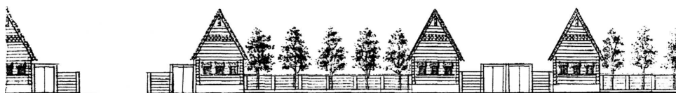
Рис. 4. Схема организации удельных селений 5

Перед началом строительства казенных зданий их чертежи направлялись на утверждение вместе со сметами в Строительный комитет при Департаменте внутренних дел. За строительство зданий по образцовым проектам отвечали губернаторы, которые подавали отчет в Строительный комитет – сколько сооружений и в каких городах они построены. Это же относилось и к жилым зданиям.