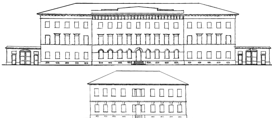
Рис. 2. Фасады губернских и уездных присутственных мест 4