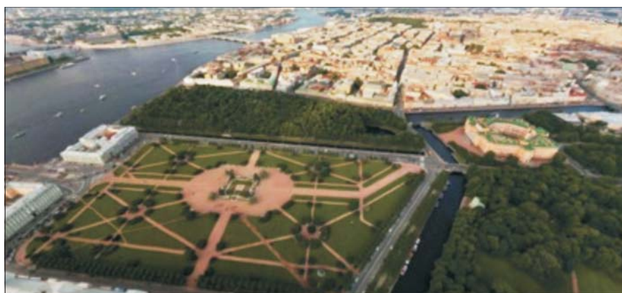
Рис. 7. Зеленые зоны, выходящие к Неве: Летний сад, Марсово Поле, Михайловский сад

Градостроительный, объемно-пространственный и архитектурный ландшафт города формировался на протяжении трех столетий, благодаря