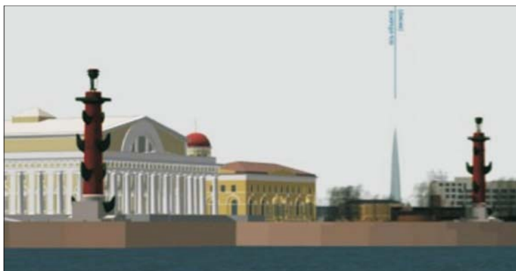
Рис. 8. Здание Лахта-центра в исторической панораме Биржи

ненаучного подхода к решению сложной проблемы сочетания «нового» и «старого». Характерным примером является появление в исторической речной панораме невокских берегов центра Санкт-Петербурга здания Лахта-центра. Здание, расположенное на значительном расстоянии от исторической части города, в силу своей высоты (462 м) просматривается с различных точек центра. Задолго до начала строительства небоскреба экспертами была выполнена модель, согласно которой при взгляде с Дворцовой набережной небоскреб оказывался почти одинаковой высоты с северной роstralной колонной (рис. 8), просматривался из окон Зимнего дворца и «работал» в системе силуэта комплекса Петропавловской крепости. Если наблюдатель находится на Троицком мосту, здание Лахта-центра чуть меньше, чем Великокняжеская усыпальница. Уже очевидно, что в зону влияния небоскреба попала почти вся Сенатская площадь, треть Дворцовой площади, основная часть Дворцовой набережной, треть Петропавловской крепости, вся набережная Макарова, Тучков мост.