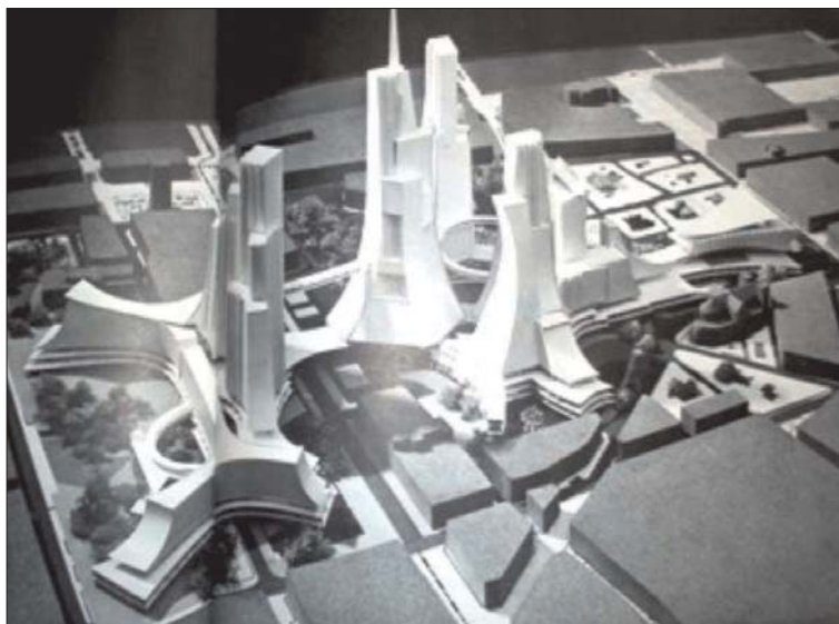
Рис. 1. Проект реконструкции центрального рынка «Чрева Парижа». Ж. Фонжерон, 1965 г.

вия старого и нового чрезвычайно важен. Особую актуальность приобретает возникновение новых высотных доминант в так называемых «лакунах» исторического центра, а также появление высотной застройки в визуальных границах этой территории.