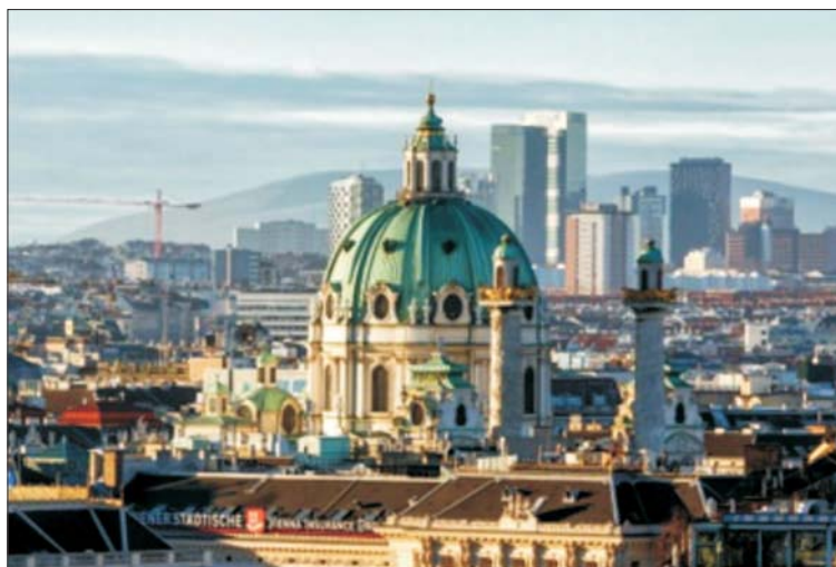
Рис. 3. Современная панорама Вены.

с конца 1950-х гг. на волне восторженного увлечения современной геометризмованной архитектурой «из стекла и бетона». К признакам «современности» относилось и строительство высотных зданий. Так, в конце 1960-х гг. на конкурс проектов реконструкции центрального рынка Ле Аль – «Чрева Парижа», среди прочих были представлены и проекты, основанные на «обогащении» исторической среды высотными доминантами [1]. Например, проект Ж. Фонжерона предлагал разместить в этой части Парижа пять башен, высота которых достигала 40–60 этажей (рис. 1). Таким образом, историческая застройка была обречена служить фоном для новых высотных зданий. Экстремальный проект Фонжерона не был одобрен, но тем не менее в 1969 г. было начато строительство 150-метровой башни Монпарнас, ставшей первой доминантой, нарушающей исторический архитектурный ландшафт (рис. 2).