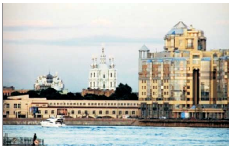
Рис. 13. Жилой дом на Воскресенской набережной

На слиянии Невы и Большой Невки в 1910–1912 гг. архитектором А.И. Дмитриевым был возведен Училищный дом им. Петра Великого, ставший силуэтным акцентом этой части набережной (рис. 11). Элитный жилой комплекс «Аврора», построенный в 2005 г. на противоположном берегу Большой Невки, практически повторил силуэт Училищного дома, но в значительно более крупном масштабе. Венчающая башня этого крупного высотного здания явно напоминает купольно-шпилевое завершение Училищного дома (рис. 12). От этого крупномасштабного «подобия» невысокое историческое здание кажется еще ниже и роль одной из доминант невской панорамы практически сводится к нулю. Подобный прием можно видеть и на Воскресенской набережной (рис. 13). Громоздкий силуэт жилого дома полностью нивелирует изящный Смольный собор в невской панораме этой части города.