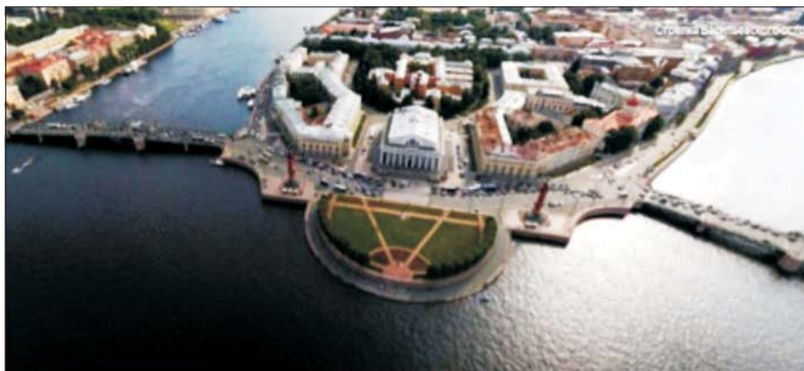
Рис. 6. Невская акватория в районе Стрелки Васильевского острова

Структура исторических районов Санкт-Петербурга представляет собой сложную взаимосвязь разновременных архитектурно-планировочных типов застройки, сложившихся в середине XVIII – начале XX вв. Городская среда ядра Петербурга обладает историко-культурной преемственностью, учитывающей градостроительный опыт и воспроизводит его в контексте функционального наполнения и развивающихся социальных процессов [3]. В силу сложившихся социальных и экономических условий Санкт-Петербург долгое время оставался городом, сохраняющим свою объемно-пространственную идентичность, свой градостроительный генетический код [4].