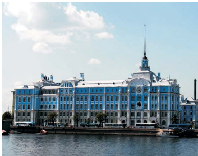
Рис. 11. Здание Училищного дома

Укрупнение масштаба новых доминант по отношению к масштабу исторической застройки негативно влияет на объемно-пространственную целостность, нарушает идентичность исторической застройки. Гладкие, почти без деталей фасады новых сооружений входят в определенное противоречие с мелкой пластикой исторических построек, снижая их значимость. Примером такого подхода является жилой комплекс «Монблан», построенный в 2003–2008 гг. на Пироговской набережной. Крупномасштабный объект, превышающий высотой окружающую историческую фоновую застройку, имеет «расползающийся» силуэт, не характерный для исторического