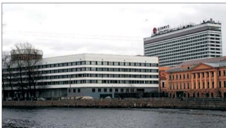
Рис. 5. Гостиница «Советская» в панораме реки Фонтанки

Целью настоящего исследования стал ландшафтно-визуальный анализ влияния высотных объектов, расположенных на территории исторического центра или вблизи него, на восприятие исторического ландшафта Санкт-Петербурга. Для этого были определены зоны влияния высотных объектов и зданий повышенной этажности, выявлены районы наибольшего воздействия этих объектов, их визуальные коридоры восприятия и степень изменения силуэта исторической части города.