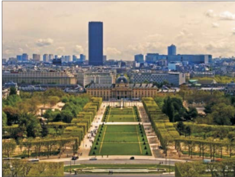
Рис. 2. Башня Монпарнас в Париже

с конца 1950-х гг. на волне восторженного увлечения современной геометризмованной архитектурой «из стекла и бетона». К признакам «современности» относилось и строительство высотных зданий. Так, в конце 1960-х гг. на конкурс проектов реконструкции центрального рынка Ле Аль – «Чрева Парижа», среди прочих были представлены и проекты, основанные на «обогащении» исторической среды высотными доминантами [1]. Например, проект Ж. Фонжерона предлагал разместить в этой части Парижа пять башен, высота которых достигала 40–60 этажей (рис. 1). Таким образом, историческая застройка была обречена служить фоном для новых высотных зданий. Экстремальный проект Фонжерона не был одобрен, но тем не менее в 1969 г. было начато строительство 150-метровой башни Монпарнас, ставшей первой доминантой, нарушающей исторический архитектурный ландшафт (рис. 2).