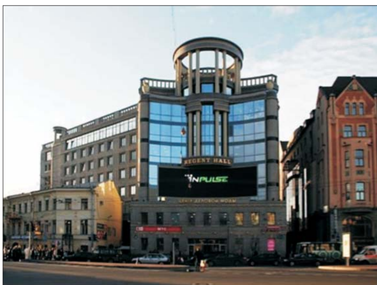
Рис. 9. Здание торгово-офисного центра «Regent Hall» на Владимирской пл.

ненаучного подхода к решению сложной проблемы сочетания «нового» и «старого». Характерным примером является появление в исторической речной панораме невокских берегов центра Санкт-Петербурга здания Лахта-центра. Здание, расположенное на значительном расстоянии от исторической части города, в силу своей высоты (462 м) просматривается с различных точек центра. Задолго до начала строительства небоскреба экспертами была выполнена модель, согласно которой при взгляде с Дворцовой набережной небоскреб оказывался почти одинаковой высоты с северной роstralной колонной (рис. 8), просматривался из окон Зимнего дворца и «работал» в системе силуэта комплекса Петропавловской крепости. Если наблюдатель находится на Троицком мосту, здание Лахта-центра чуть меньше, чем Великокняжеская усыпальница. Уже очевидно, что в зону влияния небоскреба попала почти вся Сенатская площадь, треть Дворцовой площади, основная часть Дворцовой набережной, треть Петропавловской крепости, вся набережная Макарова, Тучков мост.