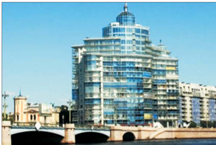
Рис. 12. Жилой комплекс «Аврора»

Санкт-Петербурга (рис. 10). Вторгаясь в панораму набережной Невы, он разрушает историческую силуэтную линию [9].