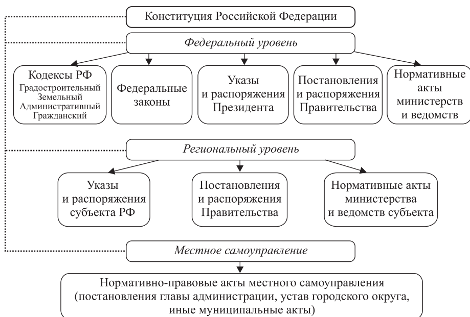
Рис. 1. Основные нормативно-правовые документы, регулирующие деятельность по благоустройству территории муниципального образования

возвращающийся к офлайн-общению. Преимущественно городскому населению России нужны комфортные оазисы для общения. Этой цели служит общественное пространство: здесь встречаются старые и молодые, бедные и богатые, здесь безопасно, здесь есть на что посмотреть. Все эти компоненты влияют на субъективное благополучие, один из показателей «Индекса счастья».