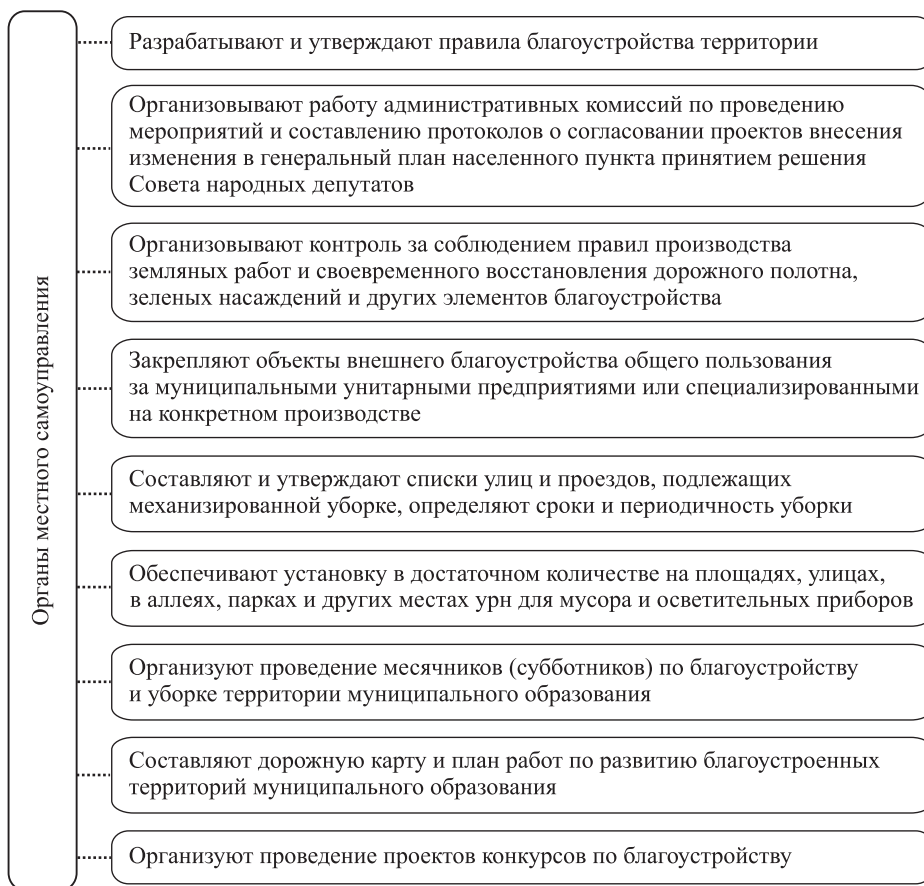
Рис. 2. Основные полномочия органов местного самоуправления в сфере благоустройства

Из анализа мирового опыта и профессиональной научной литературы не выявлена идеальная модель в управлении благоустройством муниципального образования, подходящая для всех территорий страны [7, 8]. В сфере благоустройства представлен огромный выбор национальных систем с различными специфическими особенностями законодательств, культуры, традиций, которые часто в разных областях разнятся между собой. Учитывая материал, представленный в данной статье, можно сделать вывод, что у органов местного самоуправления есть все ресурсы, чтобы общественные про-