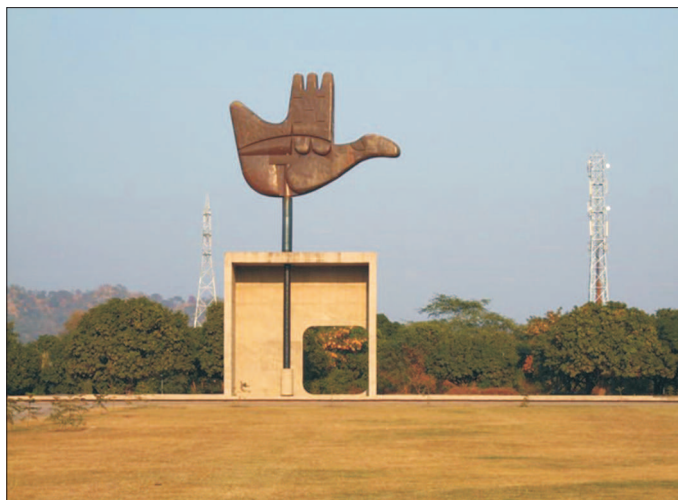
Рис. 1. Ле Корбюзье. Монумент «Открытая рука», Пенджаб, Индия, 1950–1965

Важнейшее значение для становления инсталляции и новой архитектуры с ее рационалистическим направлением имела европейская архитектура 1920-х гг. Ле Корбюзье (рис. 1). Своими литературными работами, проекта-